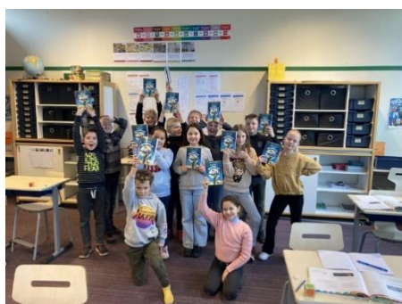
Groep 5/6 van De Runde

Vorig jaar heeft de school meegedaan aan de actie 'Geef een boek cadeau'. Groep 7/8 heeft toen het dagboek van Anne Frank gekregen. Wij vinden lezen en leesplezier erg belangrijk en stimuleren dat graag. Daarom hebben de kinderen van groep 5/6 van beide scholen, vóór de voorjaarsvakantie het actieboek van dit jaar allemaal cadeau gekregen; Dolfje weerwolfje. We wensen de kinderen veel leesplezier!